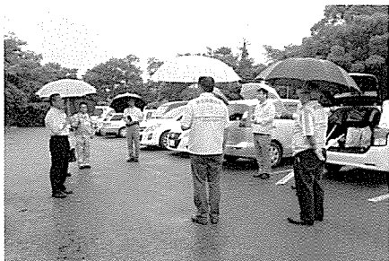
豊橋市駐車場で行政担当者も参加して出発式