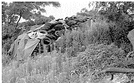
高田町地内の県道沿いに古タイヤ500㎡が不適正保管