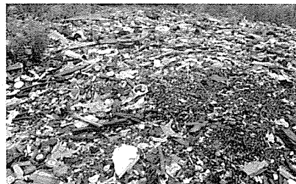
高山町地内の埠頭入口に金属、汚泥など混合廃棄物が約10トン不法投棄

当取材は8時45分に豊橋市駐車場に集合後、A班に同行し国道1号線より北側の豊橋市内、表浜海岸沿いをパトロールしました。