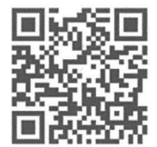
フロン排出抑制ポータルサイト QRコード