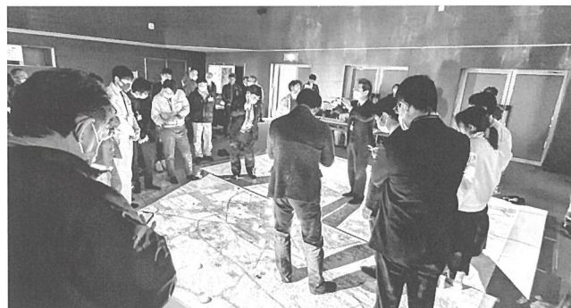
プロジェクションマッピングで理解を深める