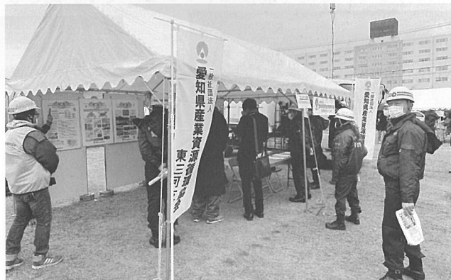
多くの行政の方が東三河支部のテントを訪れました。