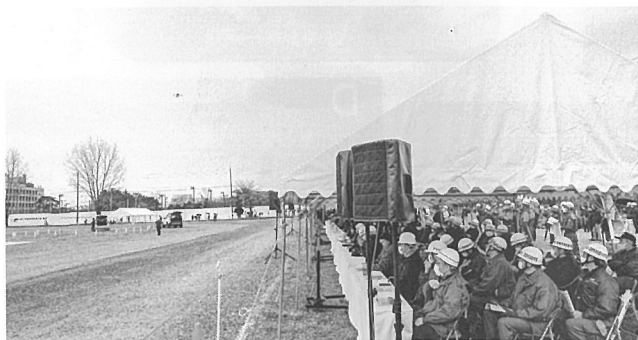
訓練参加者の皆様

当日は雨天でしたが、東三河支部の取組を多くの方に周知啓発できた防災訓練の参加となりました。