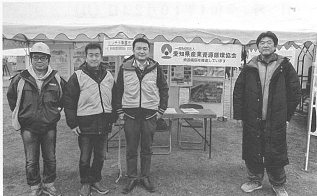
東三河支部の参加者4名とカメラ撮影者1名