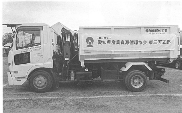
（株）加藤解体工業のコンテナ車