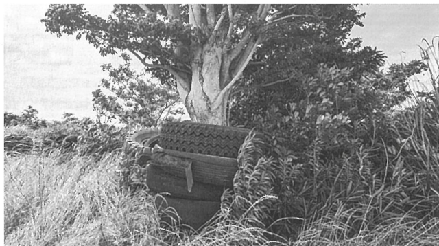
田原市西宝珠のタイヤ、自動車部品の不法投棄。草木で覆われているが、約1000m 3

毎年開催されている東三河支部の広域にわたる不法投棄防止パトロールは、昨年の不法投棄されていた箇所も確認を兼ねて回ります。地道な作業ですが、この積み重ねが東三河支部地域全体の環境保全につながっています。