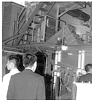
ボイラ関連設備を見学