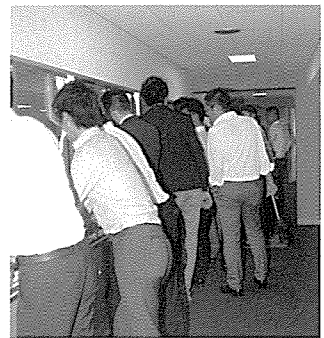
アイスクリーム工場