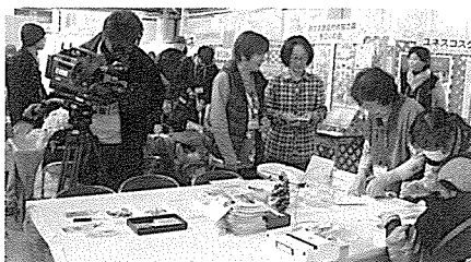
テレビ取材を受けました。