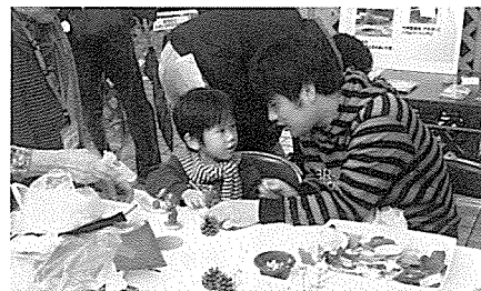
どんな作品になるのかな?