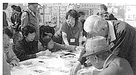
熱心に取組む男性