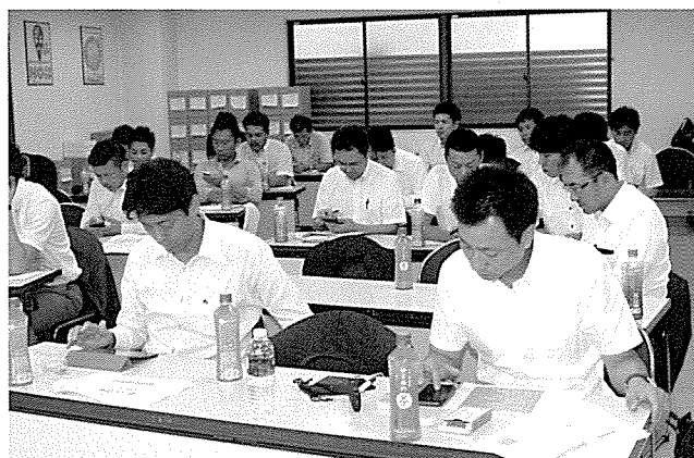
スマートフォンの画面を見て、操作を行う。