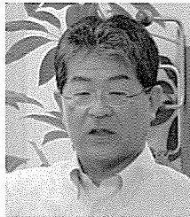
講師の（一社）愛産協 相宮環境アドバイザー

はじめに「電子の目が産廃の流れを追跡、監視する！電子マニフェストをはじめよう」と題した映像を見て、電子マニフェストの流れを確認しました。