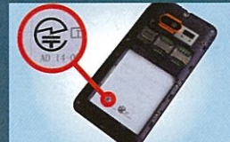
スマートフォン等では、液晶画面に 表示される場合もあります