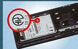
携帯電話や PHS： 内蔵バッテリーを取り外した部分