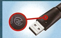
無線 LAN USB タイプの機器：背面