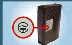
無線 LAN 据え置き型の機器：底面

多くの場合、無線機器の型式名称や製造者が記載された銘板の中や外箱に表示されています。