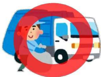
市町村の指定する方法