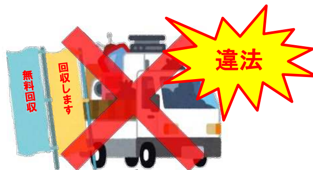
解体業者、不要品回収業者等（一般廃棄物処理業の許可なし）が回収