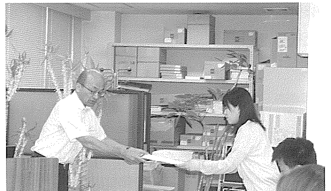
参加者には修了証が授与されました。