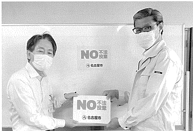
公用車用マグネット式ステッカーによる協力要請