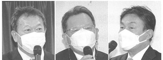
石井衆議院議員 酒井参議院議員 藤川参議院議員