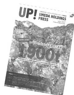
(株)宮崎発行の情報誌

清潔が一番！と言われるだけあり、とてもきれいなオフィスで女性の皆さんが、生き生きとお仕事をされている姿に感動しました！お忙しい中、取材にご協力いただきありがとうございます。