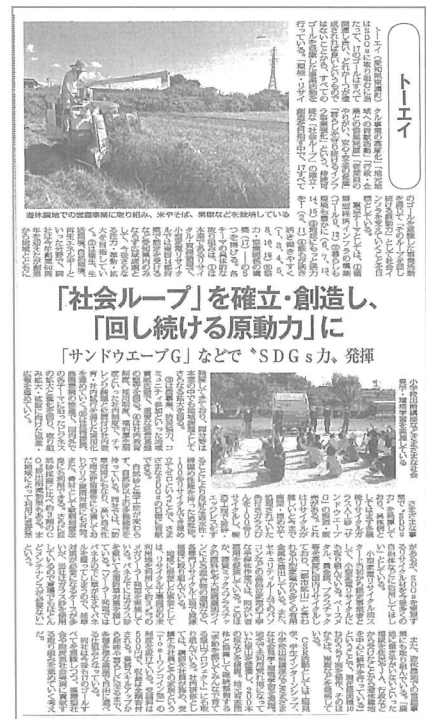
令和3年11月24日環境新聞にSDGsへの取り組みが掲載されました。