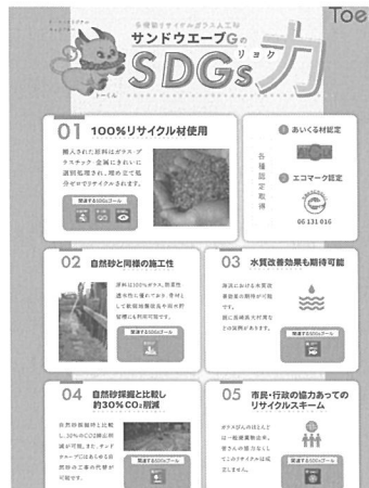
社内の SDGs 広報誌

また、ゲームが盛り上がることにより社員間のコミュニケーションが活性化し、業務においても良好