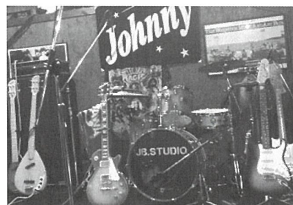
メンバー仕様の楽器