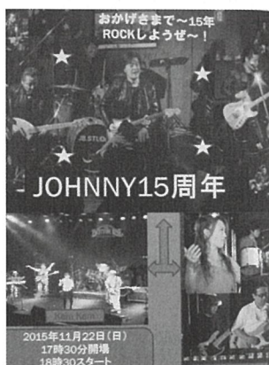
「JOHNNY」のメンバーと15周年ポスター