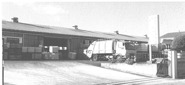
工場周辺の地面に撒かれた白い石灰