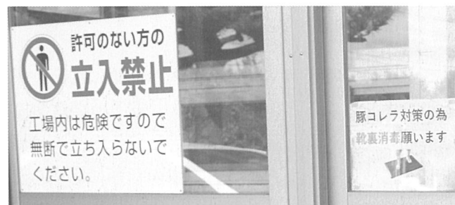
施設出入り口の消毒

食品廃棄物は、すべて原型を留めない状態まで、破碎・圧縮選別を行うとともに、受け入れ・保管、処理完了まですべてセキュリティの整った屋内で一貫して行われています。