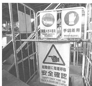
工場内位の掲示物