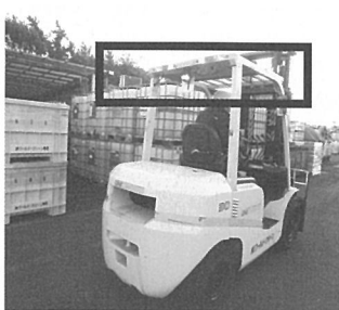
背面にランプが点灯