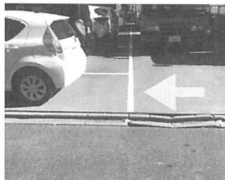
後方の白線より少し手前に停める