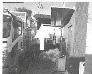
事務所前のひさしに注意