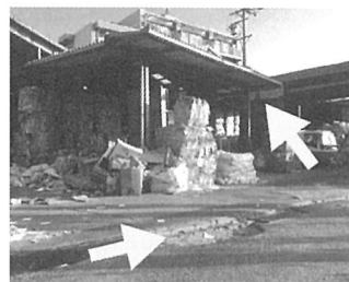
段差注意、荷下ろし時上にも注意