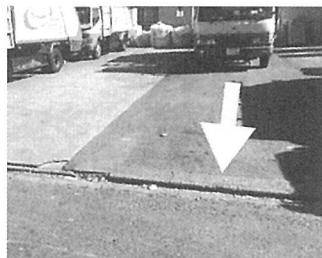
下り坂で停車時はサイドブレーキ