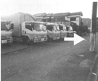
入・出庫時、電柱に注意