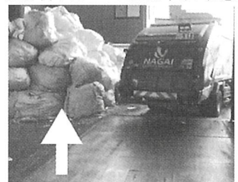
物を整理し車両通路の確保