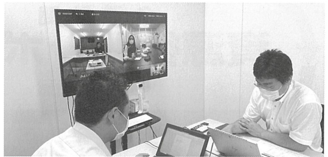
コロナ禍におけるテレビ会議