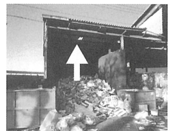
運搬車両のアームの上げ下げに注意