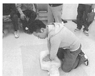
普通救命講習Ⅰの講習会