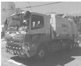
1. 安全な場所での停車 2. 停車時ハザードランプ点灯、バック時は安全な誘導を行う