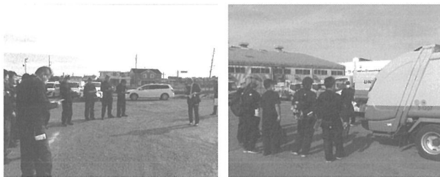
講師から塵芥車の構造について説明を受ける