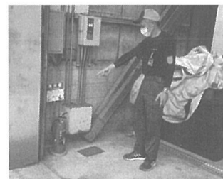
搬入口付近に設置された消火器