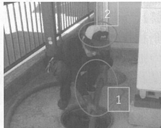
1. 軍手の着用による安全作業 2. 帽子の着用による熱中症対策