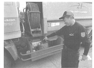
塵芥車両に搭載された消火器