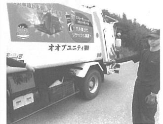
塵芥車両に搭載された消火器