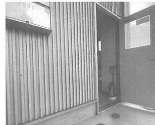
営業所の扉付近に設置された消火器