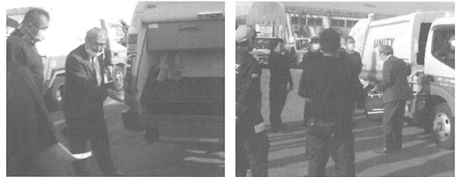
塵芥車における事故事例をもとに対策を説明する講師