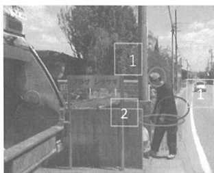
1. 腰痛に注意 2. 軍手を着用し安全積込作業