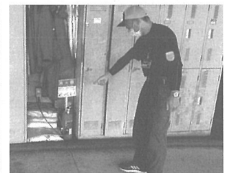
ロッカー横に設置された消火器

今号では一般廃棄物処理事業における安全衛生の取組を、同社の報告資料を基に掲載をさせていただきました。報告書は細かく要点が記載され、注意箇所が分かりやすく作成されており、産業廃棄物処理事業においても参考にさせていただく点が多々ありました。