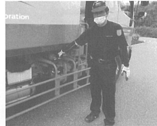
塵芥車両に搭載された消火器