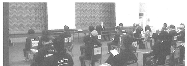
交通安全の講話を聞く

外部より講師を招き、入社3年未満の従業員が対象です。講話と実習を交えた交通安全の講習会を開催します。