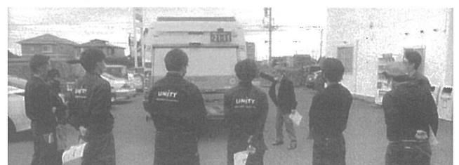
屋外で交通安全の実習を行う