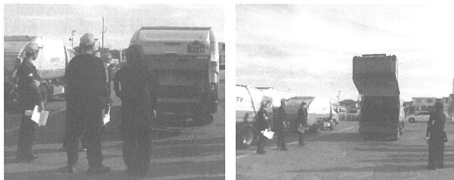
事故事例をもとに塵芥車両で確認をする