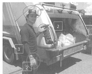
1. 腰痛に注意 2. 軍手を着用し安全積込作業 3. 帽子を着用し熱中症対策