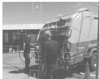
1. 腰痛に注意 2. 軍手を着用し安全積込作業 3. 帽子を着用し熱中症対策 4. 運転手・助手で協力作業