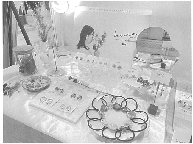
SDGs AICHI EXPO 2022(10/6~8)に出展した「hana jewelry」の展示ブースの様子

私自身もECサイトの構築や各SNSの運用等、ブランドの運営全般を手掛けています。また、ポスターやチラシ等の販促品のデザインもクリエイターらと相談して製作します。ECサイトやSNSにて発信することにより、新たな顧客獲得はもとより、