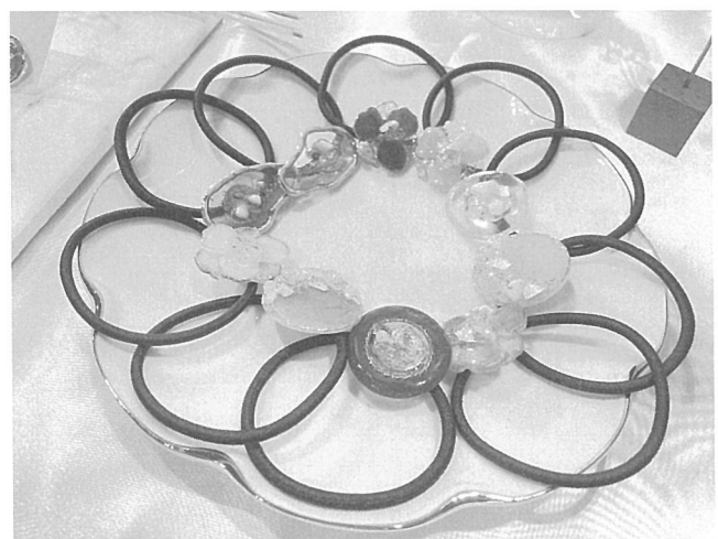
SDGs AICHI EXPO 2022において、ノベルティとして100個配布された「hana jewelry」のヘアゴム